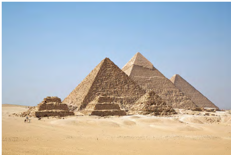
Pyramiden von Giseh

Montag Tagesausflug mit Besichtigung der Pyramiden von Giseh und des Sphinx, der Stufenpyramide von Sakkara und der Ramses-Kolossalstatue in Memphis.